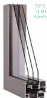
DRITTO Inviso 70 mm